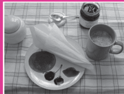
Heute hält er beim Frühstück die gebrauchte Serviette für ein Gipfeli und versucht sie zu essen.